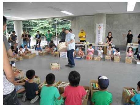
昨年のワークショップの様子