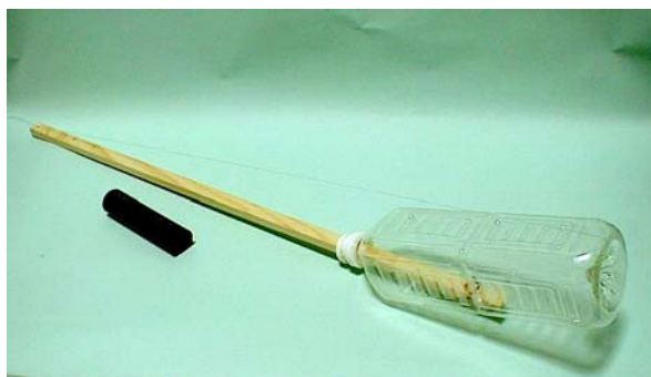
今回の課題の「弦楽器モノリン」

自分だけの音色を奏でるオリジナル楽器づくりを挑戦してみたい参加者を広く募集いたします。