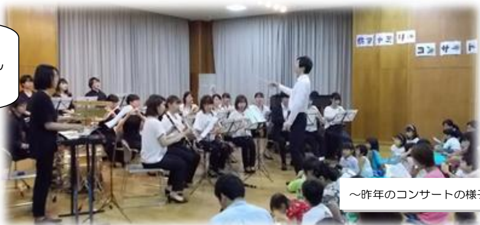
～昨年のコンサートの様子～