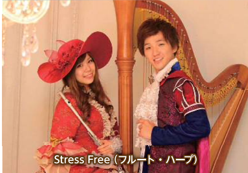
Stress Free(フルート・ハープ)