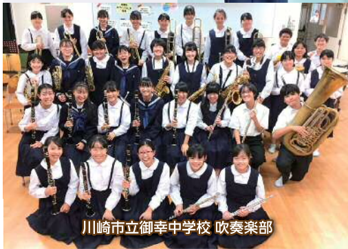
川崎市立御幸中学校 吹奏楽部