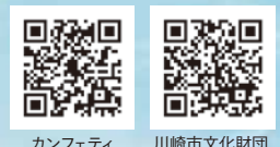
カンフェティ 川崎市文化財団

主催 公益財団法人 川崎市文化財団 〒212-8554 川崎市幸区大宮町1310 ミューザ川崎セントラルタワー5階 TEL.044-272-7366 FAX.044-544-9647