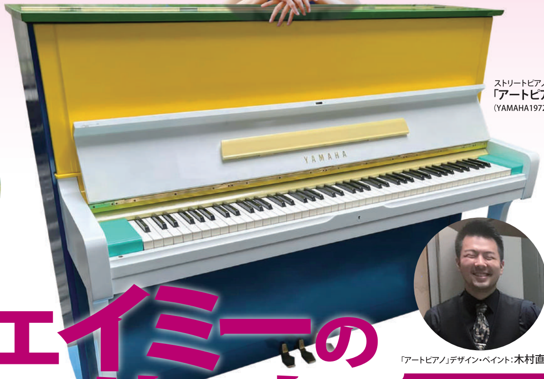
ストリートピアノ 「アートピアノ」 (YAMAHA1972年製)