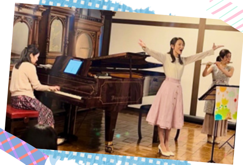
コンサートの様子

関東を中心にソロ、室内楽、吹奏楽やオーケストラの客演等、幅広く演奏活動を行なっている。 サルビア・アーティストバンク2022・23アーティスト。 国立音楽大学卒業。 洗足学園音楽大学大学院修了。