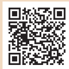
[漫画資料コレクション]