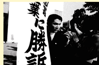
加害企業に勝利判決 1994年

1999年以来、「公害・環境、健康、まちづくりフェスタ」に取り組んでいます。今年には市政に市民の声を届けようと、小さな声も集めて大きくすることに挑みます。一緒に参加しませんか！